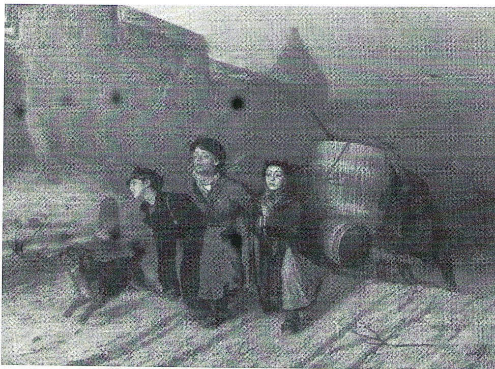
В. Перов. «Тройка»

Выберите из предложенных статей Конвенции о правах ребёнка ту статью, которая нарушена. Ответ укажите цифрой.