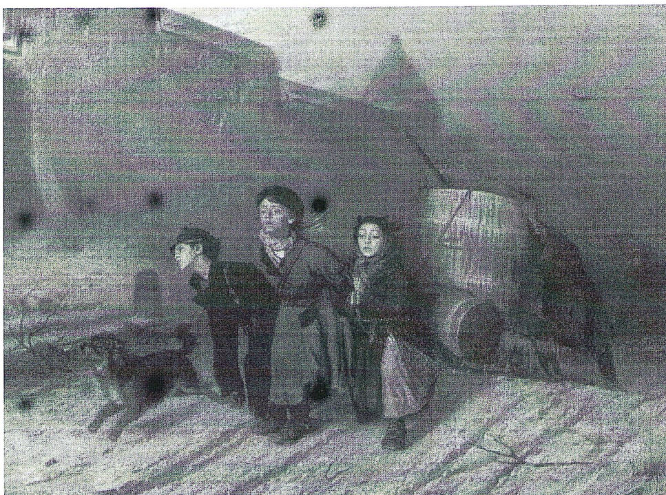
В. Перов. «Тройка»

Выберите из предложенных статей Конвенции о правах ребёнка ту статью, которая нарушена. Ответ укажите цифрой.